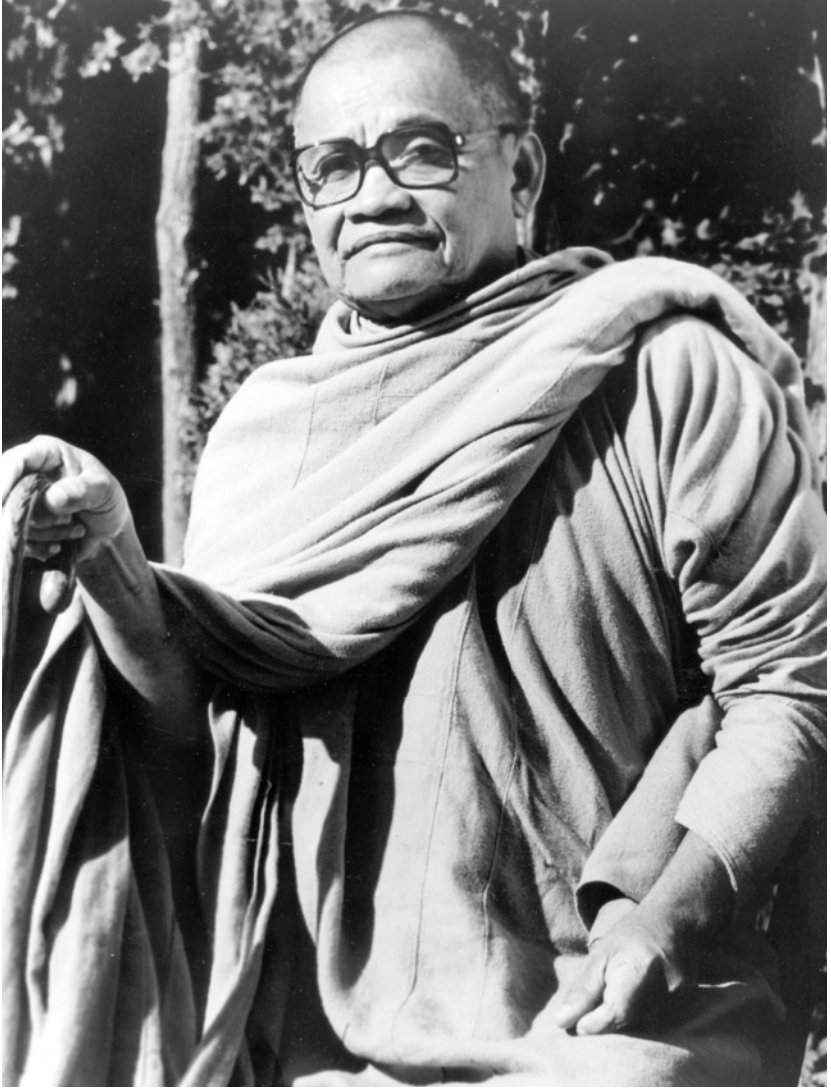
พระโพธิญาณเถร (ชา สุภทฺโท)